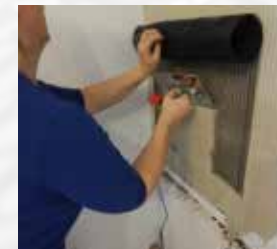
3. Gewebe eindrücken