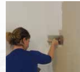
2. Spachtelmasse vorlegen