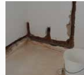
1. Installation vorbereiten

Die Arbeiten können unkompliziert von einem Maler oder Tapezierer vorgenommen werden. Dank der einfachen und sicheren Plug & Play Anschluss-technik sind keine Elektrofachkenntnisse notwendig.