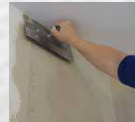
5. Feinspachteln und fertigstellen, z.B. Tapezieren