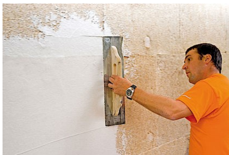
Grundputzeinbettung auf Hanfplatten